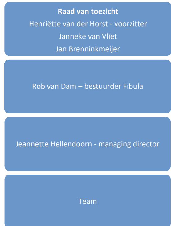
Figuur 1: organogram Fibula

Fibula volgt daarbij het streven van IKNL om de bedrijfsvoering zo in te richten dat de toegevoegde waarde voor het primair proces optimaal is en de overheadkosten en -druk zo laag mogelijk zijn. Ten slotte, Fibula is transparant over haar activiteiten en maakt deze zichtbaar via haar website, social media en door het uitbrengen van een jaarverslag, activiteitenplan en rapportages.